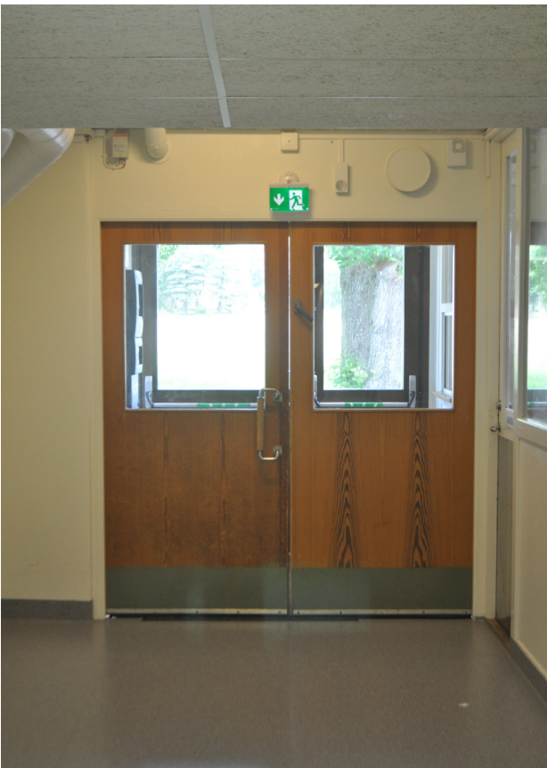
Bevarat äldre dörrparti i trä.