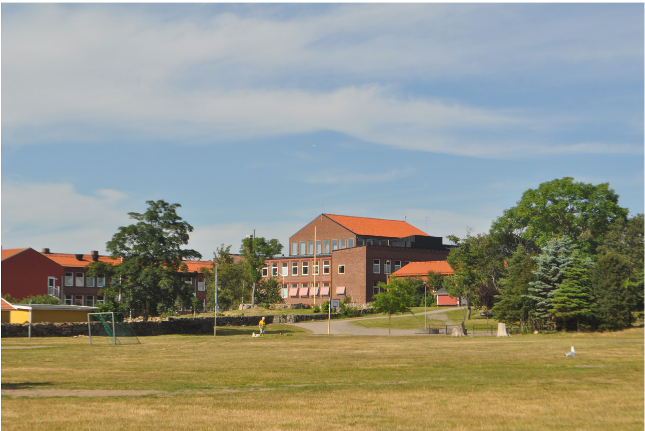
En öppen gräsplan skiljer idrottshallen från den intilliggande Påskbergsskolans område.