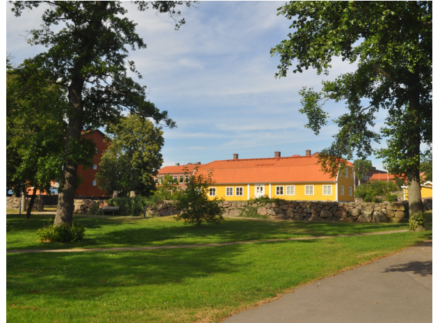
Landeriet Freden ligger nordväst om idrottshallen.

Varbergs idrottshall ligger söder om centrala Varberg, intill området Mariedal. Nordväst om idrottshallen ligger landeriet Freden med tillhörande park från 1800-talet. Området runt idrottshallen har ett enhetligt uttryck och präglas av efterkrigstidens bebyggelse. Nordväst om idrottshallen och landeriet ligger Påskbergsskolan, tidigare läroverket; en skolanläggning med flera byggnadsvolymer i rött tegel. Intill Danska vägen, Falkenbergsgatan och Ringvägen ligger grupper av lamellhus som är uppförda enligt tidens ideal med hus i park samt grupper av enbostadshus från samma tidsperiod. Intill idrottshallen ligger även en mindre idrottshallsbyggnad som tillkommit senare, men anpassats till omgivningen i sin utformning.