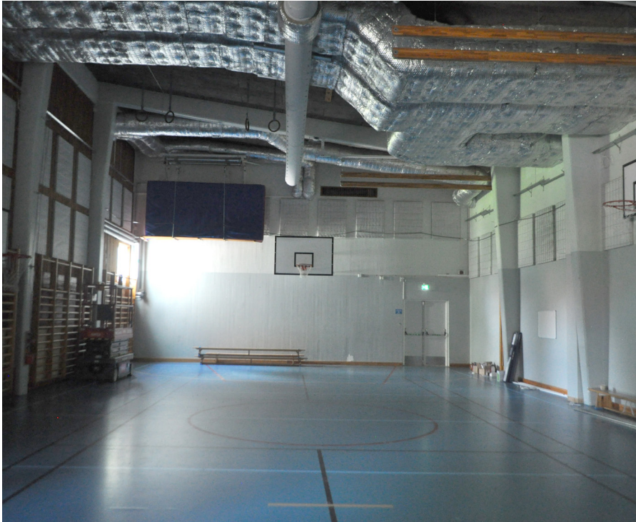
Den lilla gymnastiksalen med synlig bärande konstruktion. På väggen till vänster satt tidigare stora fönsterpartier.