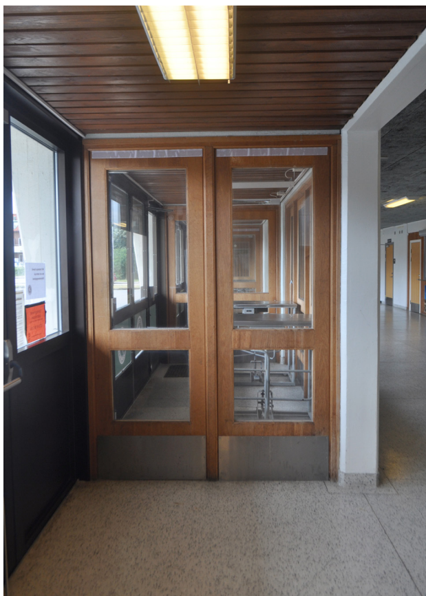
Entrén har påkostade innerdörrar i trä med sparkplåtar. I taket syns den glesa panelen.

Den stora hallen med spelplan har genomgått större förändringar där de flesta ytskikt av naturliga skäl bytts ut efterhand som de utsatts för slitage. Norr om den stora hallen finns en mindre gymnastiksal med väggar av målad betong, synliga bärande betongpelare samt en vägg som täcks av träpanel och ribbstolar. I taket hänger anordningar för gymnastikredskap. Här har tidigare funnits stora fönster vilka satts igen.