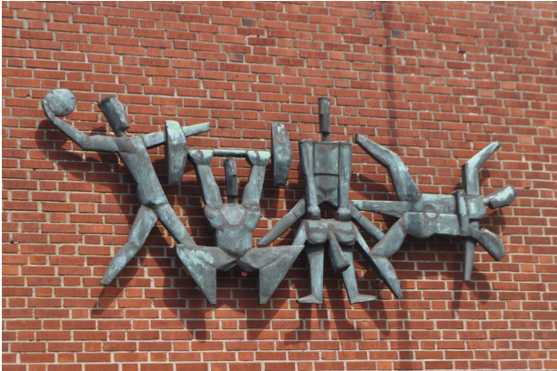
Bertil Lundgrens konstverk "Idrottsmotiv" som är placerat till vänster om huvudentrén.