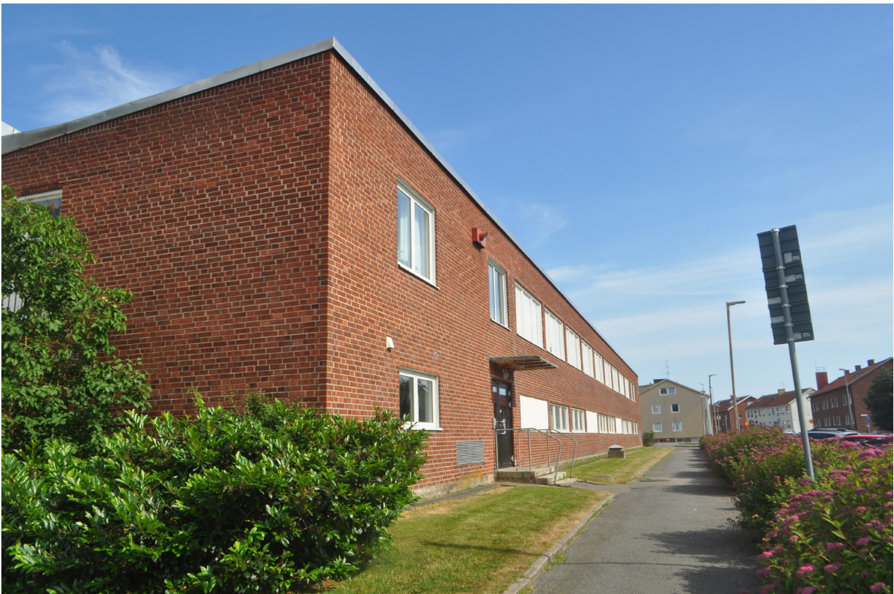
Idrottshallens västra långsida.

Interiört finns önskemål om att byta golvmaterialet i den lilla gymnastiksalen samt bygga om en mindre del av läktaren till kioskutrymme.