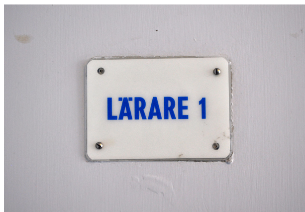
Överst: Foajen med inre dörrpartier samt golv av terazzo. Nederst: Tidstypisk skylt på en av de gråmålade innerdörrarna.