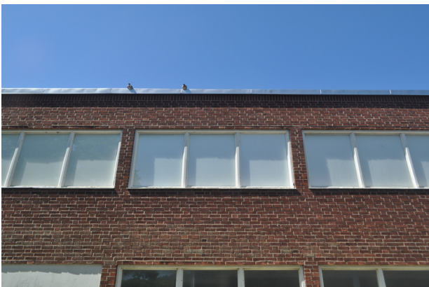
Den övre våningens fönster är placerade längs läktaren.

Överst t.h. syns huvudentrén med sin nätta skärmtakskonstruktion. Nedan t.h. syns entrén på byggnadens norra fasad. Här är den franska balkongen samt originaldörrar i trä bevarade.