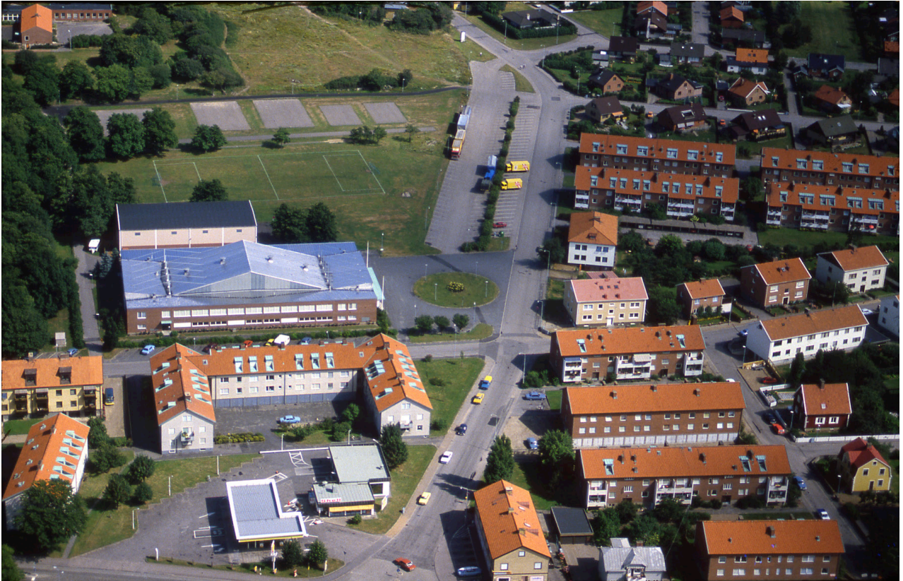
Flygbild över idrottshallen och området runtomkring, tagen 1984. Här har byggnaden tak av rostfritt stål.