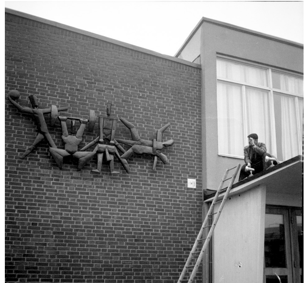
Belysningen av Bertil Lundgrens konstverk justeras.