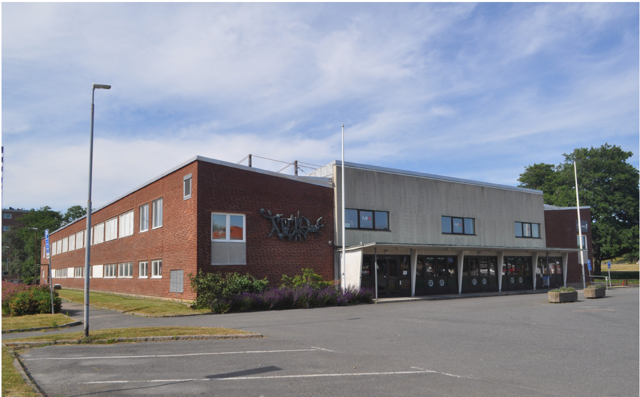
Idrottshallen från söder. Mitt på fasaden finns huvudentrén. Längs med sidorna sträcker sig långa integrerade byggnadsvolymer som bl.a. innehåller omklädningsrum och läktare.

På motsatt sida av byggnaden finns en senare tillbyggnad i två våningar som klätts in med mineritskivor. Till vänster om denna finns en entré med ursprungliga dörrar i trä med sparkplåtar samt en fransk balkong, även den i ursprungligt utförande.