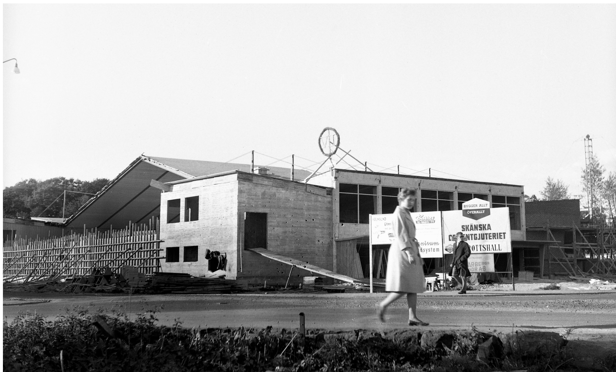
Idrottshallen under uppbyggnad.

År 1954 invigdes en ny läroverksbyggnad i Varberg som var placerad i anslutning till landeriet Freden vid Påskberget. Läroverket var ritat av arkitekten Paul Hedqvist. Man hade planerat för en gymnastiksal i anslutning till läroverket, vilken inte beviljades tillstånd hos arbetsmarknadsstyrelsen. Några år senare, 1962, uppfördes istället en fristående idrottshall intill Falkenbergsgatan, i närheten av skolan. Idrottshallen byggdes i kommu-