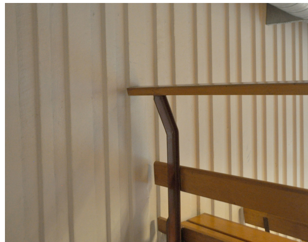
Läktarens sidoväggar i betong med randig struktur.