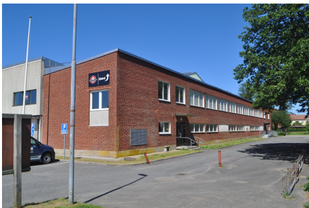
Byggnadens östra långsida. Här syns fönsterbanden som sträcker sig längs fasaden samt en av sidoentréerna.